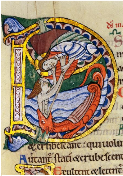
Albani Psalter. Dombibliothek Hildesheim, St. God. Nr. 1 (Eigentum der Basilika St. Godehard, Hildesheim), S. 205.